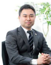
代表弁護士・中小企業診断士・社労士